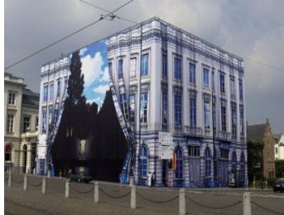
Bâche scénographiée en trompe l'oeil, musée René Magritte à Bruxelles, mai 2008

Trompe l'oeil, illusion, l'in situ, échelle, point de vue, profondeur de champ, mise en scène, perspective, les plans.