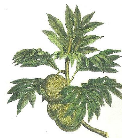
Arbre à pain de Tahiti ( Aquarelle de S.Parkinson)