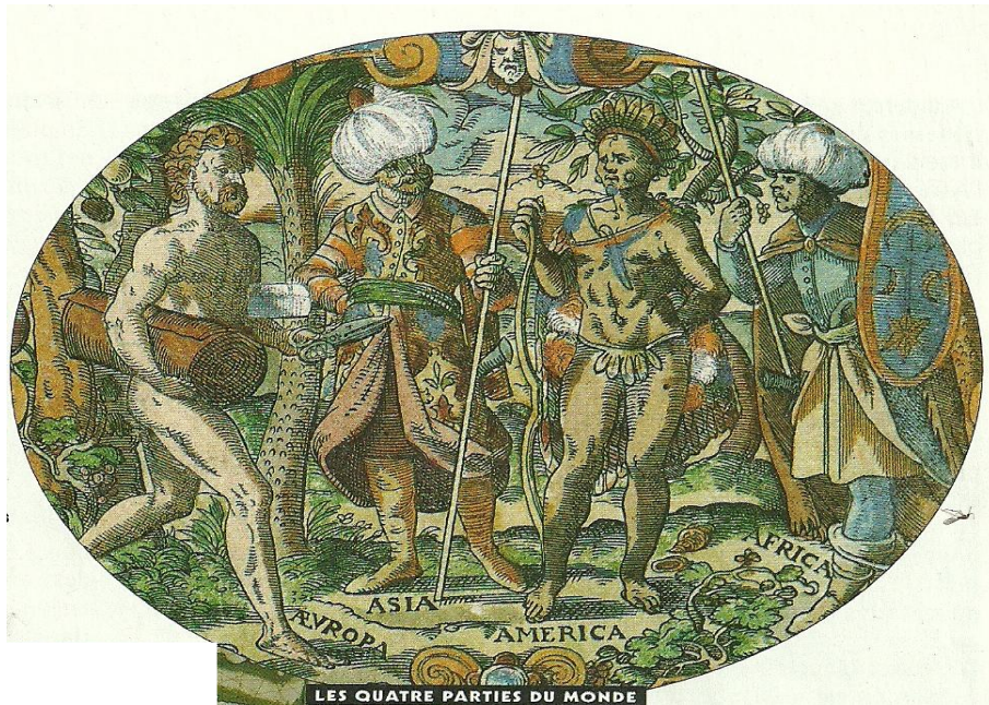
Gravure de Jost Amman en 1577