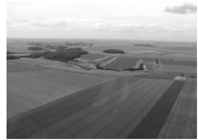
Vue des plaines de la Beauce (Bassin parisien)