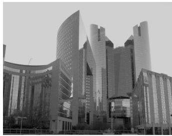
Vue de la Défense (Île-de-France)