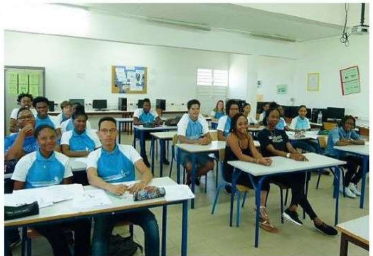
Des élèves bénéficient dès cette année d'un stage de Préparation aux études médicales et paramédicales.

En dehors de son intérêt pédagogique, l'aspect le plus intéressant du dispositif sera sa gratuité dans la mesure où il sera installé dans l'enceinte de l'établissement et permettra à des élèves issus de familles défavorisées de pouvoir en bénéficier.