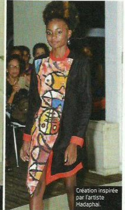
Création inspirée par l'artiste Hadaphai.