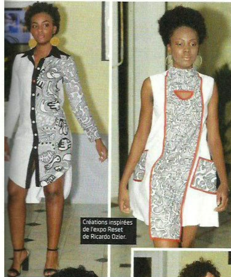
Créations inspirées de l'expo Reset de Ricardo Ozier.

Il est aujourd'hui loin le temps où les sections des métiers de la mode fermaient les unes après les autres, dans une Martinique où couture rimait souvent avec échec sco-