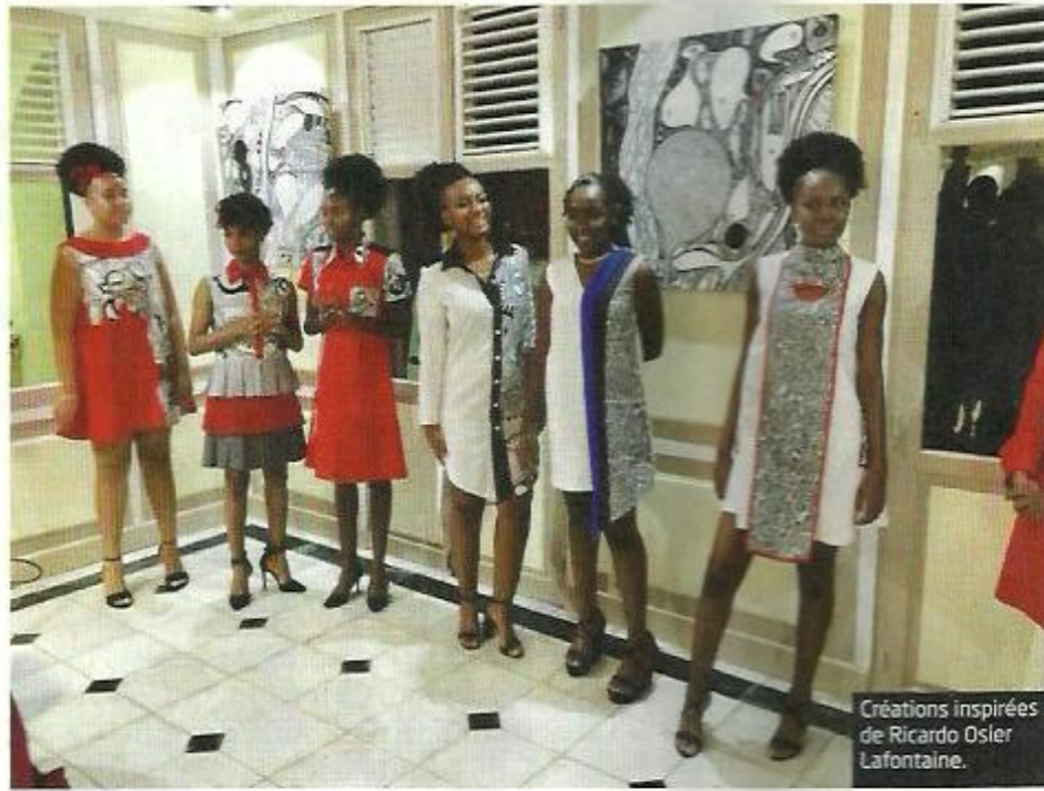
Créations inspirées de Ricardo Ozier Lafontaine.

Les représentations de la mode dans l'art ont souvent fait référence à de nombreuses structures culturelles et sociales. C'est cela que les élèves du lycée professionnel Raymond Nérès du Marin en Martinique, ont voulu mettre en exergue par une exposition Madinina Mode Art et une collection de robes résolument modesques, présentées à la villa Chanteclerc, à Fort de France.