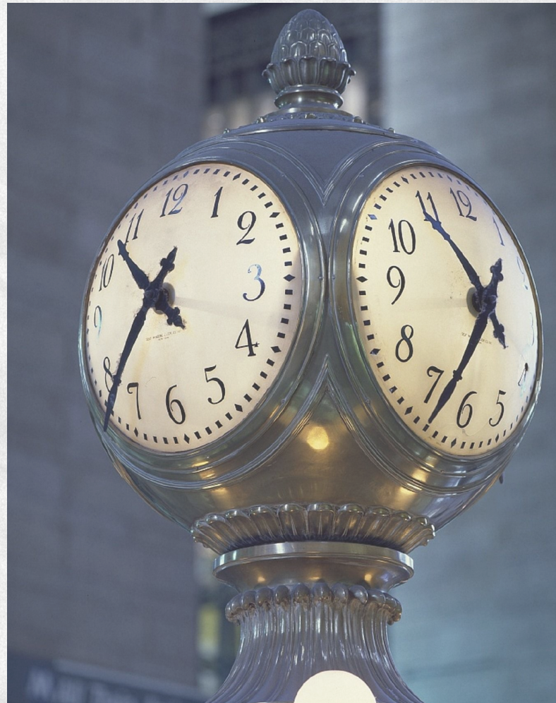
Grand Central Station clock , New York, USA