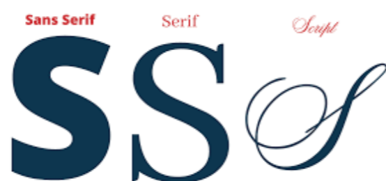
Les 3 familles de typographie

Diaporama : confiserie-sucrerie de la Martinique (doucelettes, caramel pistaches, tablettes coco lotchio, nougat pistache, ... Filibo) Le verre de Murano