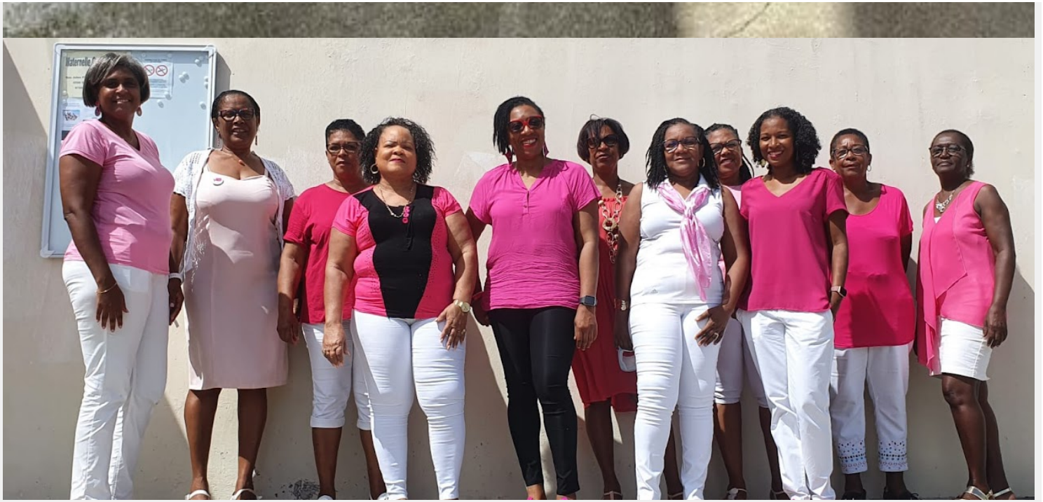
Agents et enseignants de l'école Oliny

A l'école Maxime, la célébration a eu lieu une semaine avant : des activités graphiques, de la cuisine et un temps de convivialité ont été proposés aux élèves.