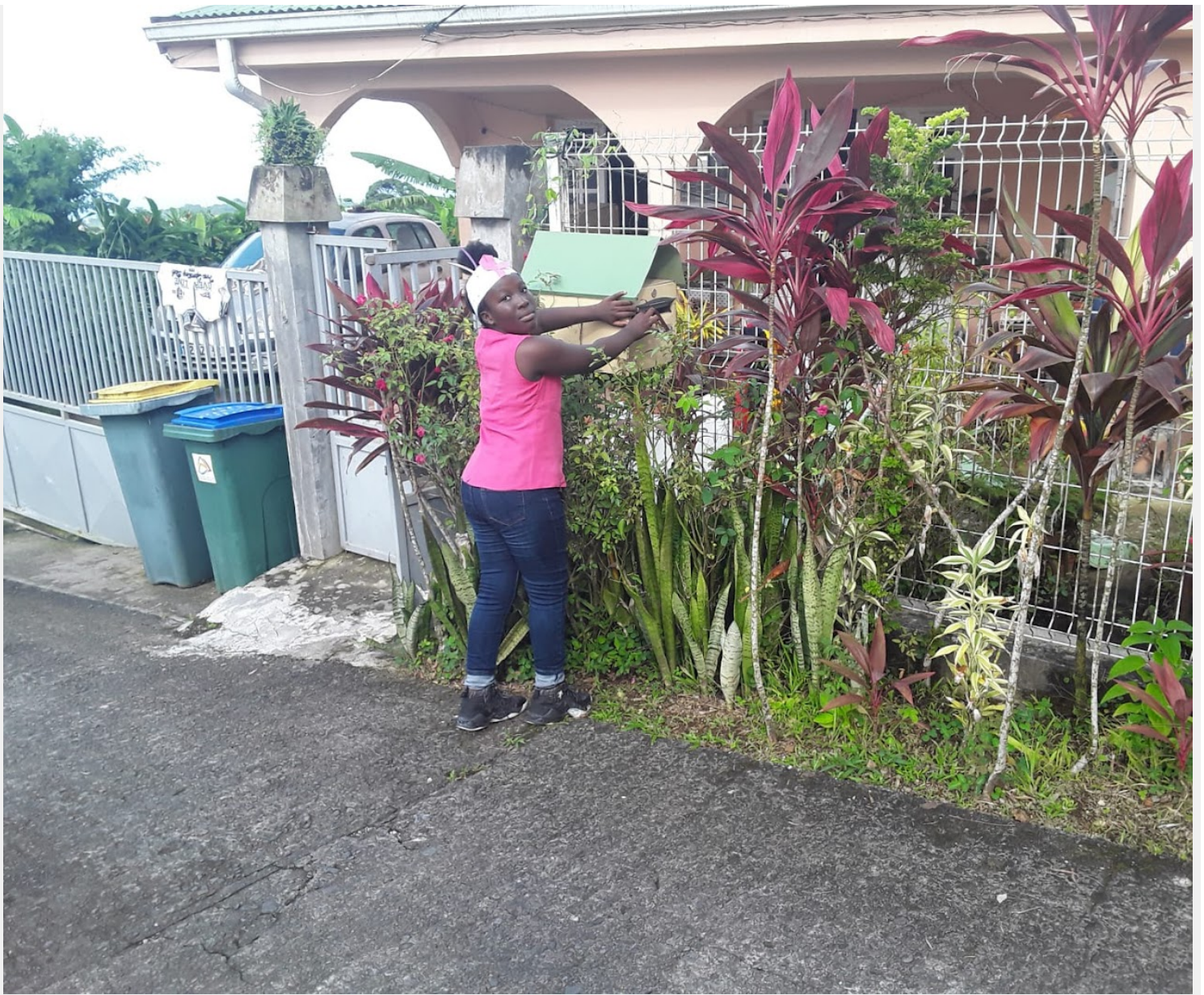
Dépôt de messages citoyens (BMR)