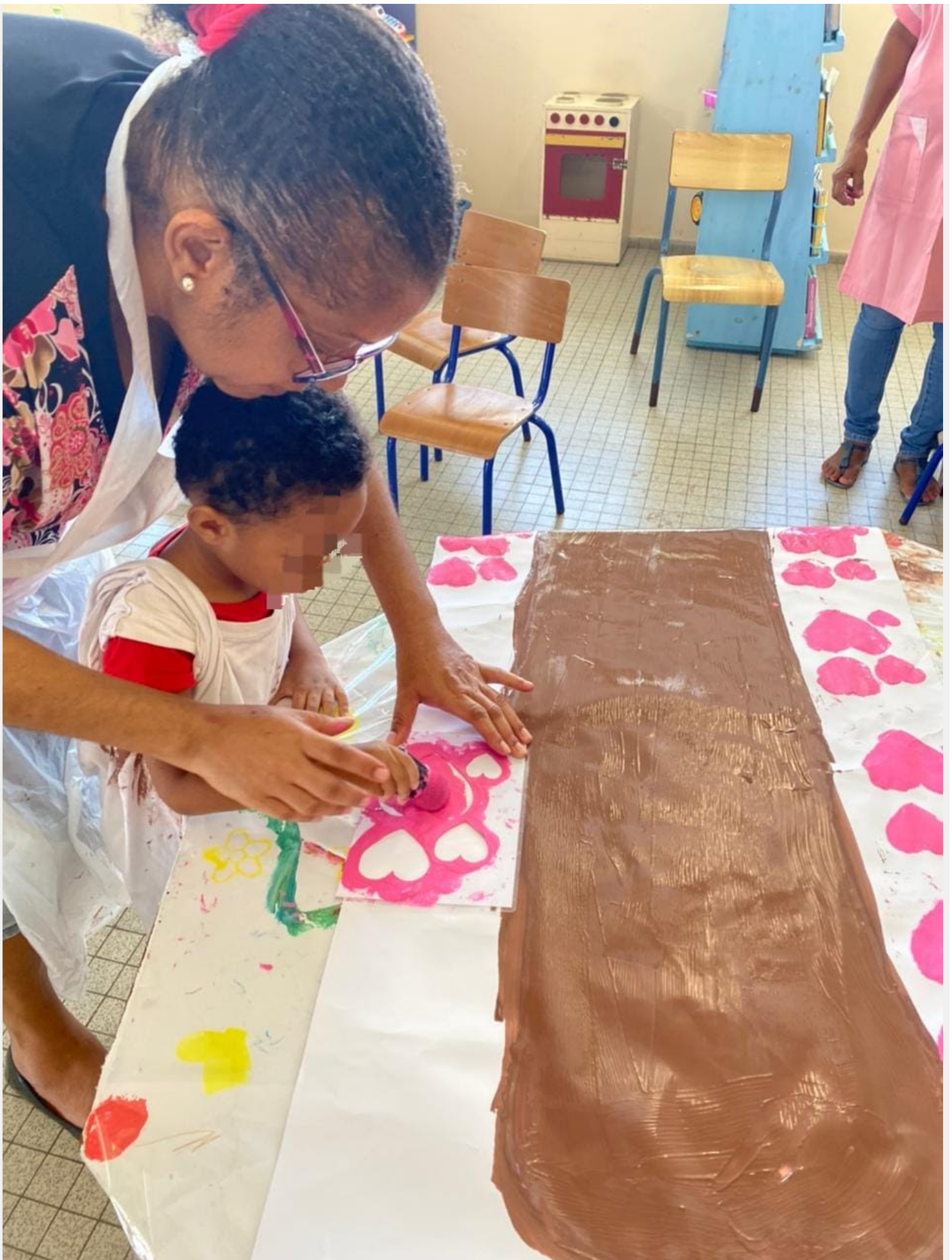
Production d'un arbre de l'espoir (maternelle Carabin) : empreintes et pochoirs