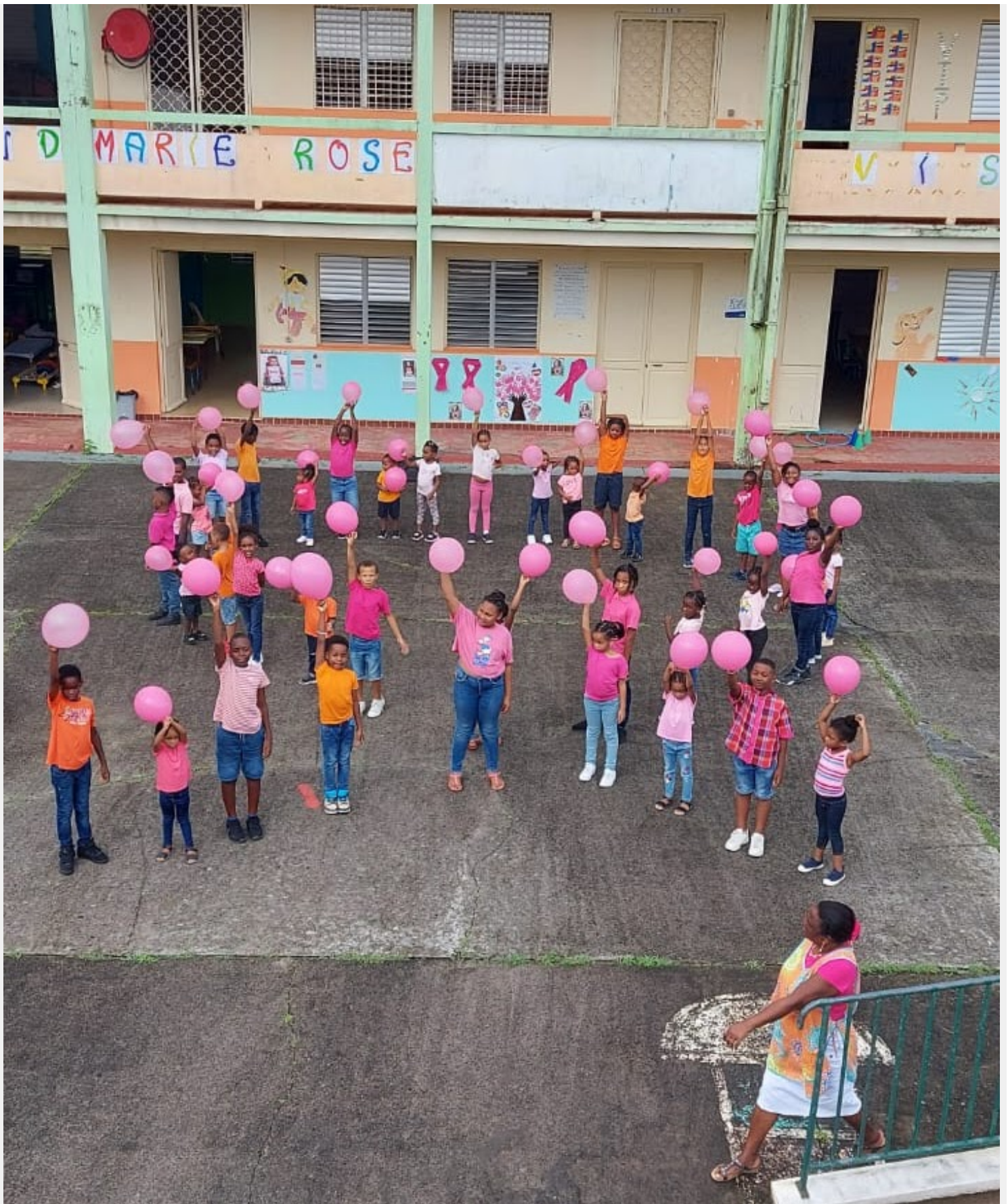
Chaîne humaine (BMR)