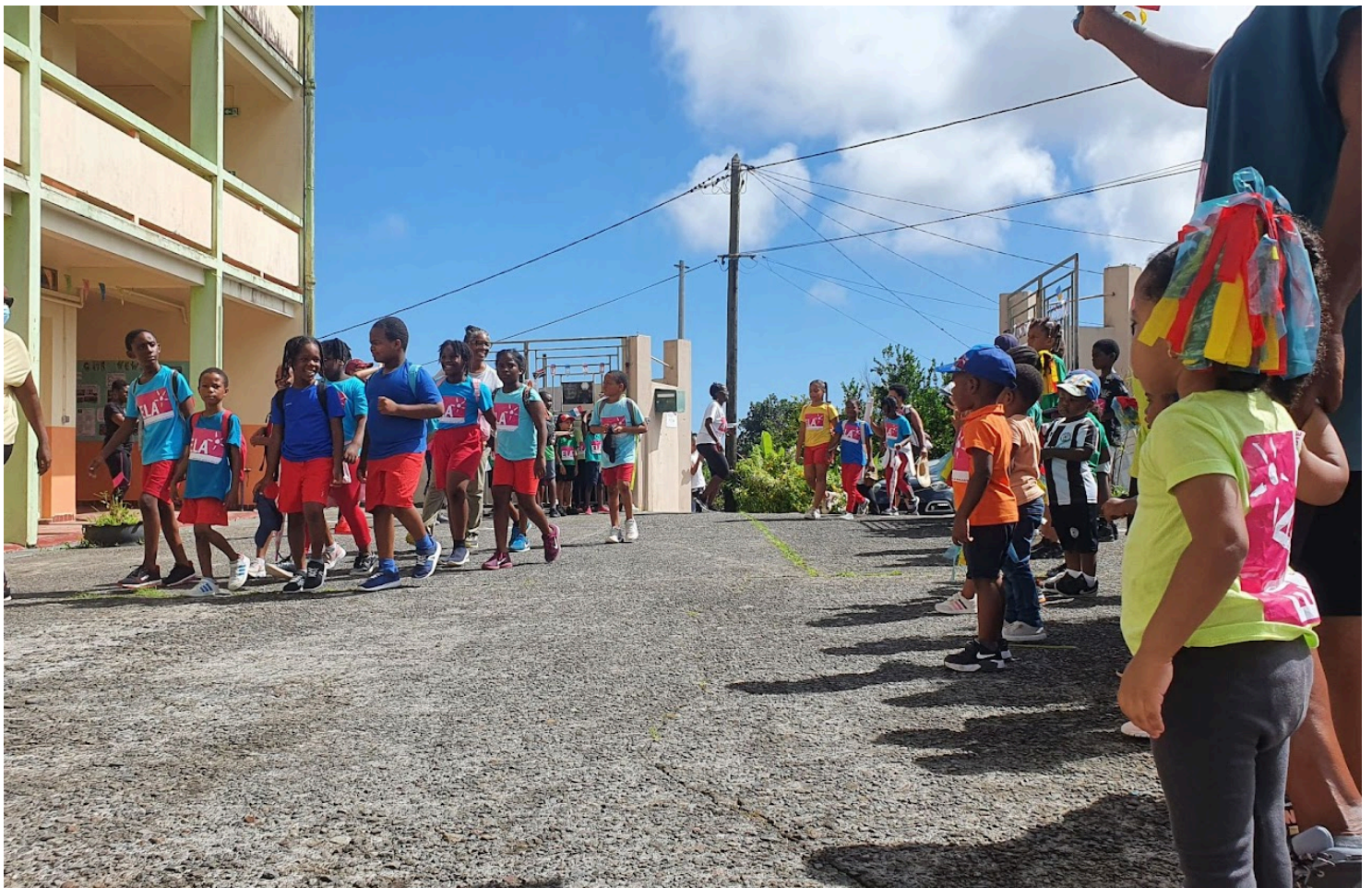
Arrivée des élèves de l'école Léon Cécile