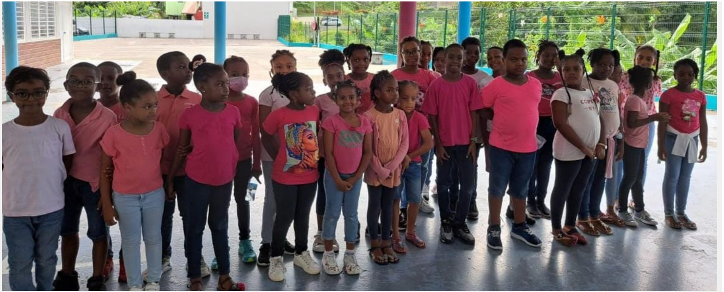
Elèves de Léon Cécile