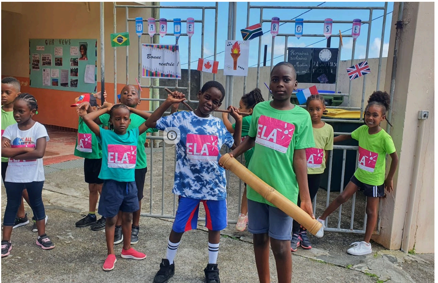
Elèves de cycle 2 prêts pour la course au bénéfice d'ELA, association en faveur de la recherche pour la leucodystrophies