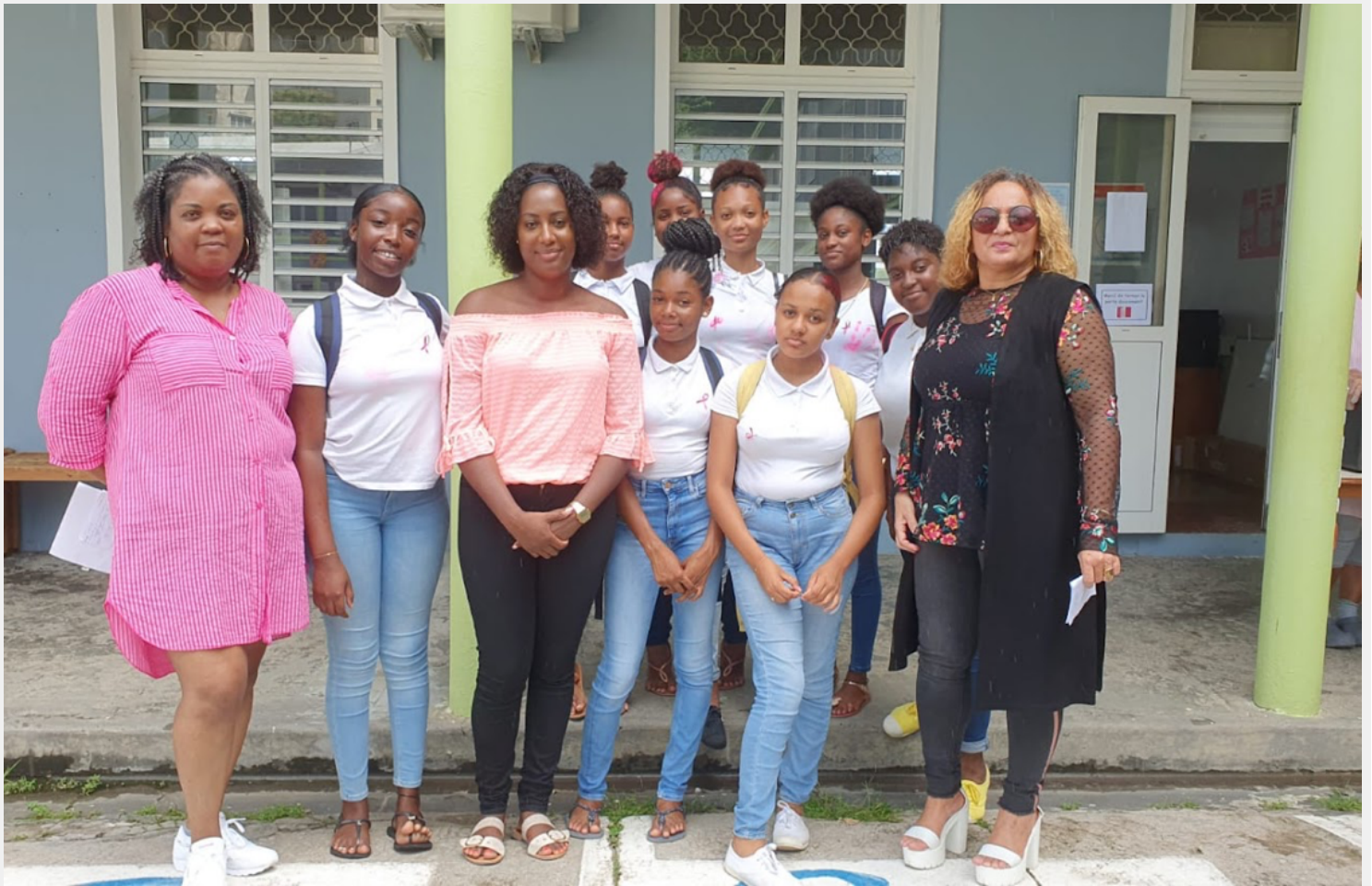
Vie Scolaire, Infirmière, Direction, élèves (collège)