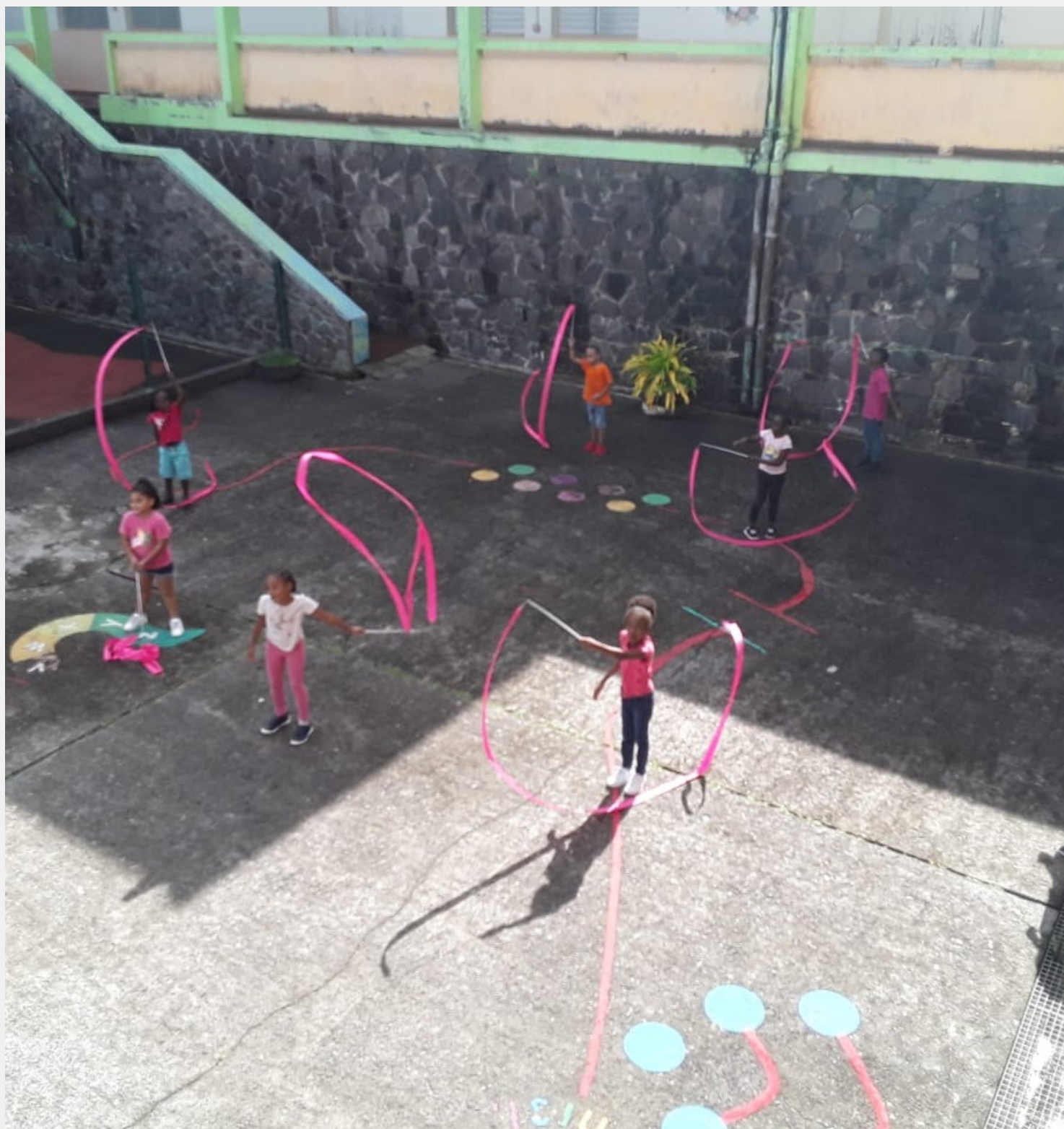
Danse des rubans (BMR)

A l'école Berteau Marie-Rose, les élèves ont rédigé des textes en faveur du dépistage et sont allés les distribuer dans les boîtes aux lettres du quartier. Les élèves de CP et CE1 ont dansé avec des rubans de GRS.