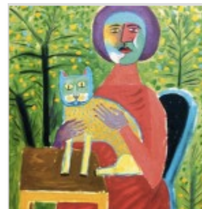
Victor Brauner. 1929.

A l'école mixte A Rivière Salée, l'équipe pédagogique s'est penchée sur la mise en place d'outils pour résoudre les conflits au sein de la classe ou de l'école. Les jeunes élèves deviennent ainsi responsables de la résolution de leurs propres problèmes en trouvant des solutions non violentes en autonomie.