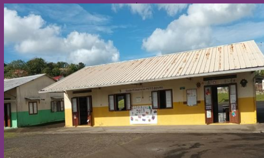
Ecole élémentaire de Petit Bourg à Rivière -Salée