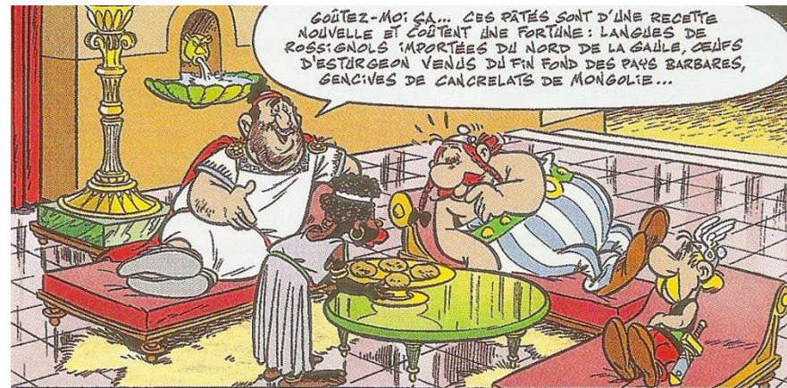
René Goscinny et Albert Uderzo, Astérix gladiateur (1964), © Dargaud