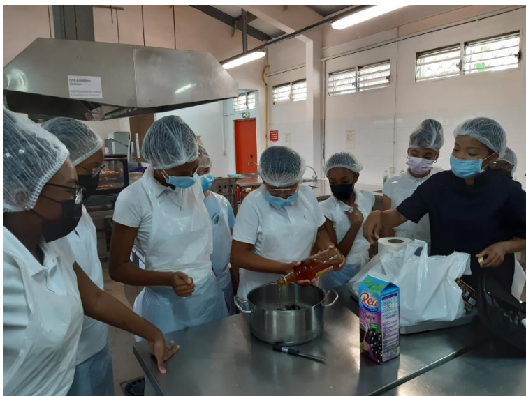
Préparation du sirop