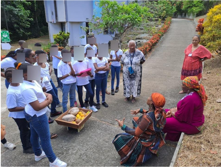
Les élèves avec les porteuses.