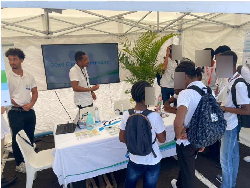
Animation sur la transition énergétique (L'utilisation des véhicules à hydrogène)

Après cette excursion d'une bonne heure, ils ont ensuite pu bénéficier d'autres animations : l'une sur la transition énergétique et l'autre sur les métiers exercés à la raffinerie.