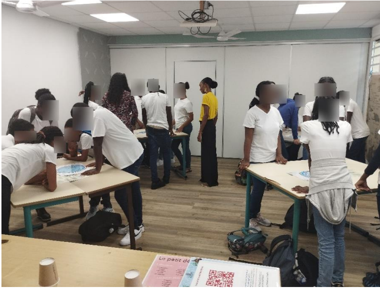
Atelier Merveilles du ciel