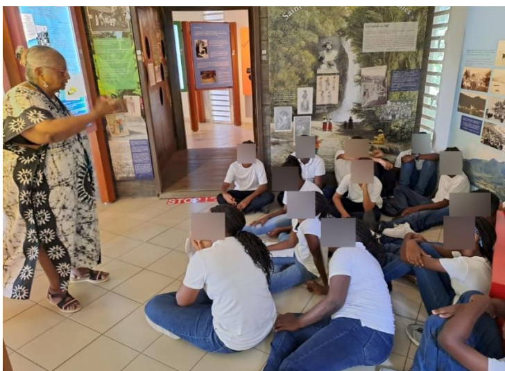
Musée Paul GAUGUIN

Pour redonner vie à ce métier inconnu des plus jeunes, deux porteuses professionnelles originaires de la République d'Haïti, ont initié nos élèves à l'art du portage de marchandises.