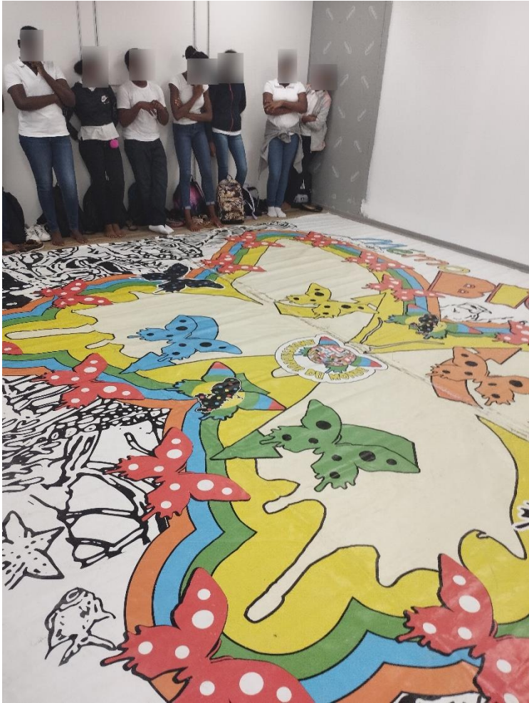
Atelier Mémo Biotuji : jeu de plateau grandeur nature.