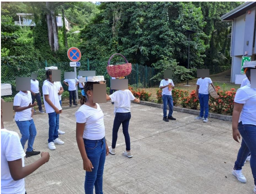
Initiation au portage de marchandises.