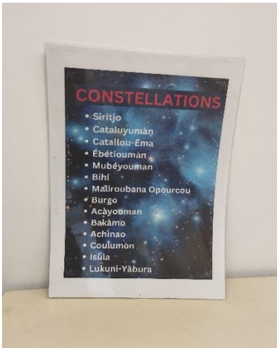
Les constellations au temps des amérindiens.