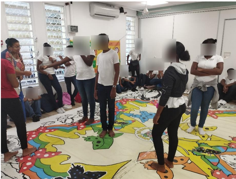
Début de la partie