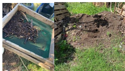
Photo 3 - Réalisation du terreau organique

Jaden Yich Nou: un jardin pédagogique dédié aux élèves de l'école primaire Clémence CARISTAN du Prêcheur. Il y est pratiqué une agriculture bio puisque les déchets transformés à l'EKopost servent de nutriments au jardin.