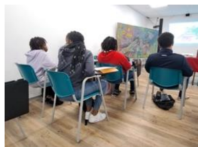
Photo 4 - Les éco-délégués lors de l'intervention de CAP Nord