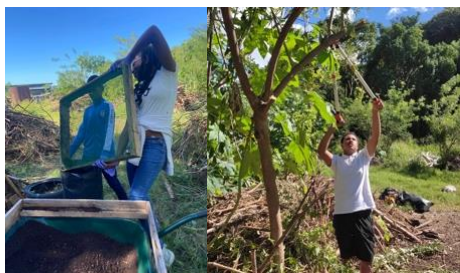
Photo 2 - Les élèves en action au sein de l'Ekopost