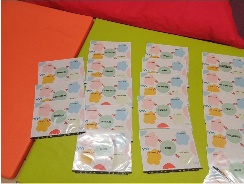
Les cartes du quiz