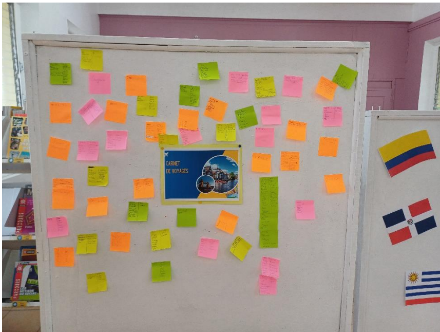
les élèves rêvent de visiter.