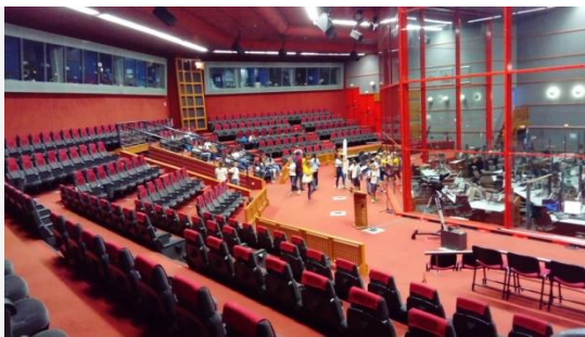
Salle officielle pour le décompte

Nous avons terminé notre voyage par une visite et du Shopping au centre ville de Cayenne.