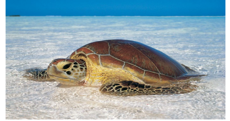
Les tortues caouannes

Les tortues caouannes sont aussi appelées « Carette » elles sont progressivement en voie de disparition . Elles sont carnivores et mangent des crustacés , leur carapace est en forme de cœur. Elles peuvent pondre de 64 à 198 œufs en une seule fois. Elles peuvent mesurer 1,25 mètre mais en moyenne les adultes peuvent mesurer 1,10m. Elles vivent dans les eaux tropicales et subtropicales. Elles sont capables de parcourir des distances considérables .