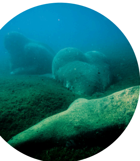
Manman Dlo & le tombeau des Caraïbes