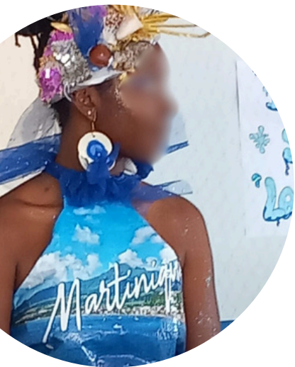
Dlo sé lavi