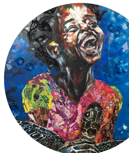
Dlo sé trézo nou an nou protéjey

Une exposition photos, peintures, et autres objets autour de la thématique de la pollution de l'eau.