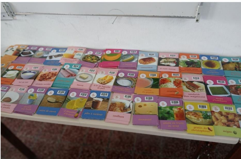
Equilibre alimentaire et Produits sucrés