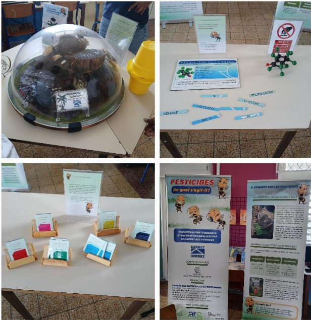
Pesticides : de quoi s'agit-il ?