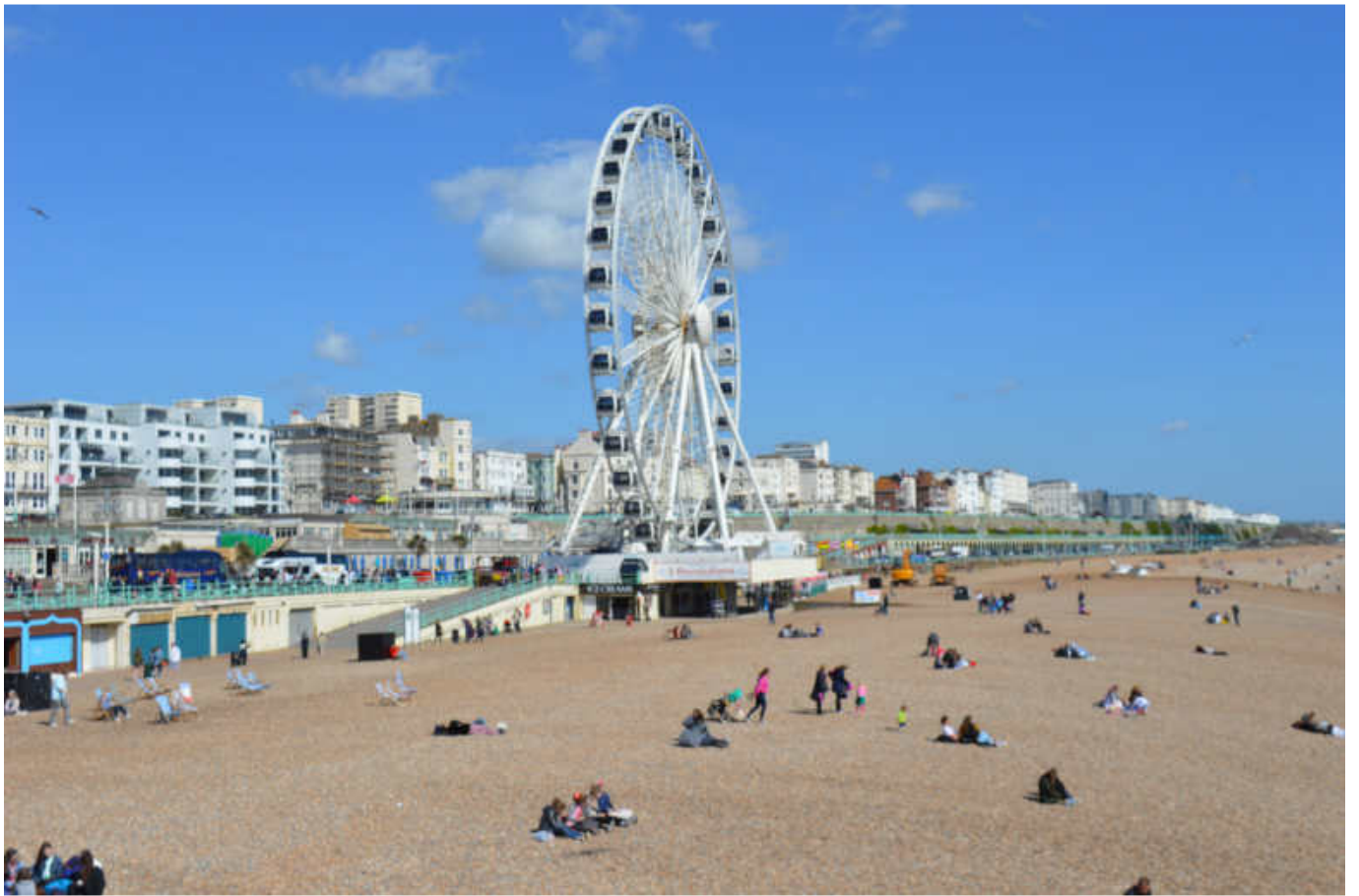
- le Sea Life Centre