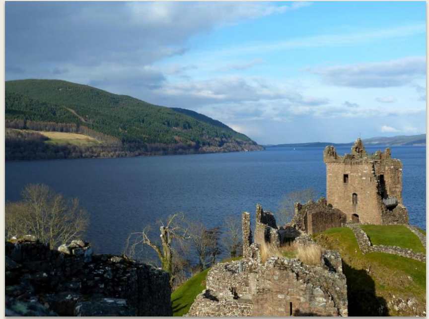
Ruines d'Urquhart Castle, point stratégique dominant le lac appartenant à la ligne défensive des garnisons du Great Glen