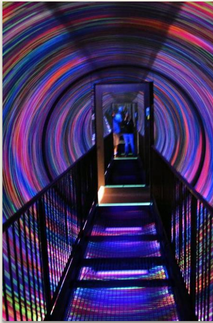
Camera Obscura and World of Illusions, présentation interactive de l'histoire de la ville