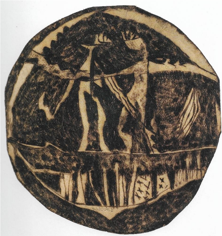
Louis LAUCHEZ, Lanmou gwo monn , 2007, Ecorce gravée, 54 x 52 cm