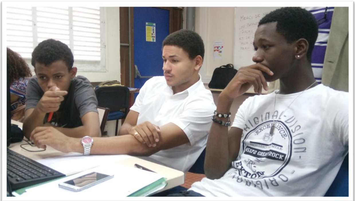
Photographie de jeunes élus du CAVL travaillant sur une activité de recherche en vue du montage de ce projet