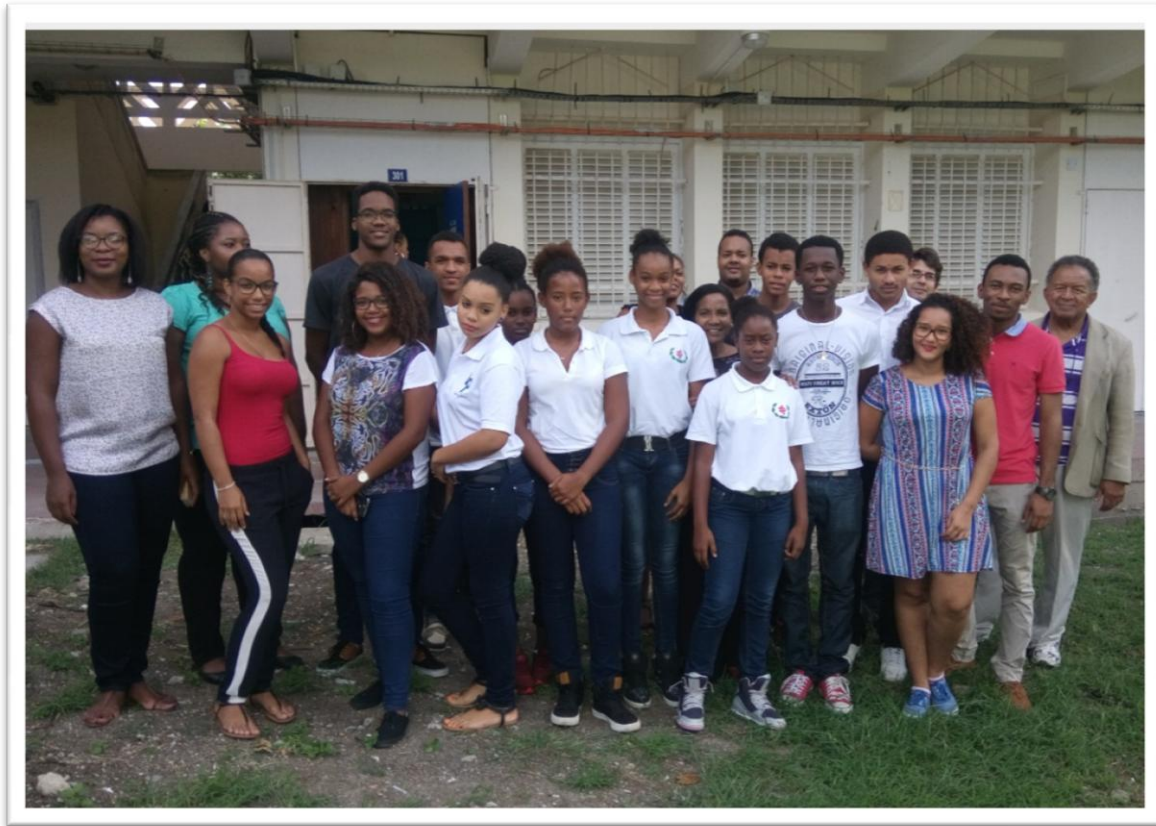
Les porteurs du projet

(photo prise lors d'une séance de travail en vue de définir le contenu de l'exposition)