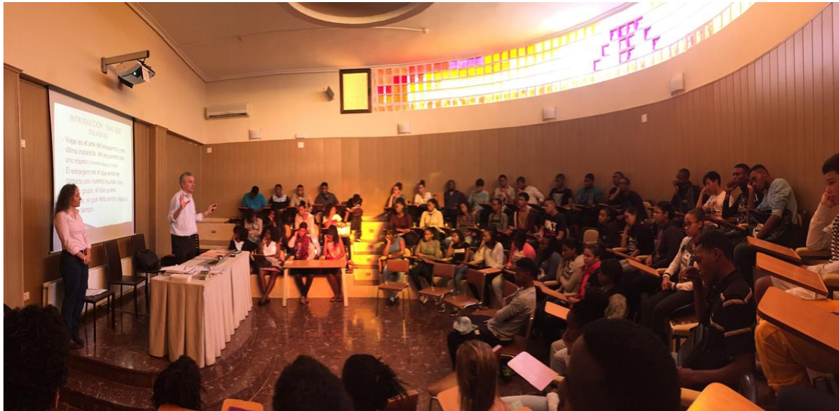
L'amphithéâtre de l'école de Valence Nos élèves et le directeur