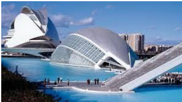
Las ciudades de las artes y de las ciencias