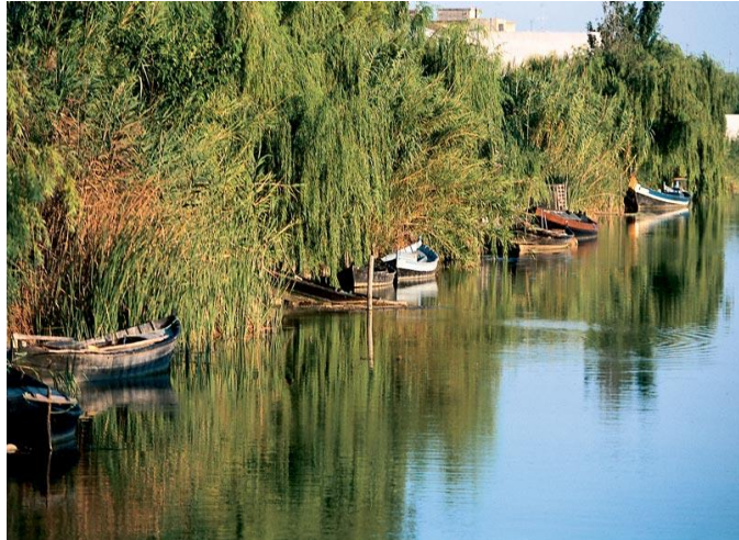
La Albufera en Valencia