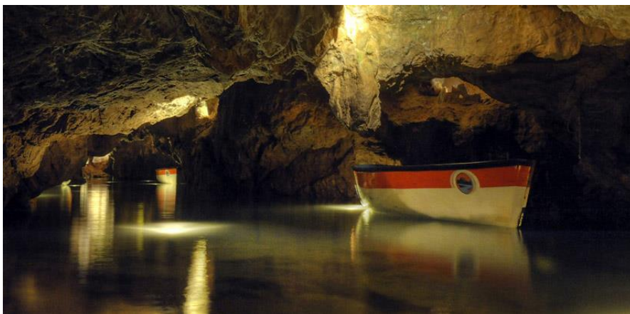
La cueva de Vall d'Uxió