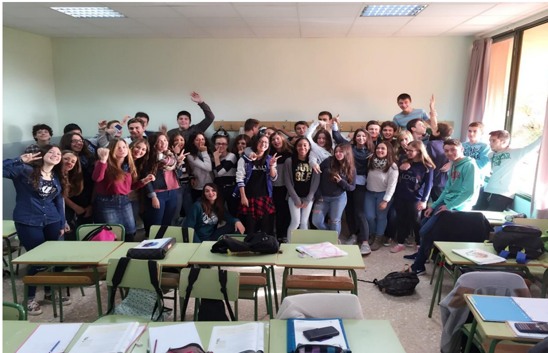
Nos homologues espagnols