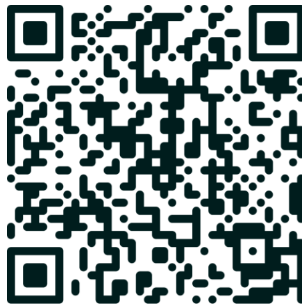
Doc 3. La capture des esclaves. Extrait du film AMISTAD

4 fusils boucaniers Ou 30 bassins de cuivres Ou 9 onces de gros corail Ou une caisse de tambour Ou 100 livres de cire jaune Ou 100 pintes d'eau de vie Ou 4 écharpes de soie Ou 30 barres de fer (...) Ou 4 pièces e toiles indiennes (...) D'après Savary des Bruslons, Dictionnaire du commerce, 1723.