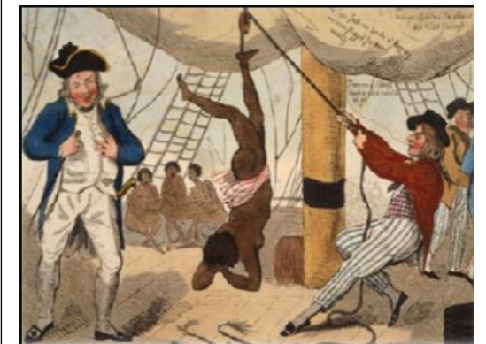
Doc 4 : répression d'une rébellion sur un navire négrier