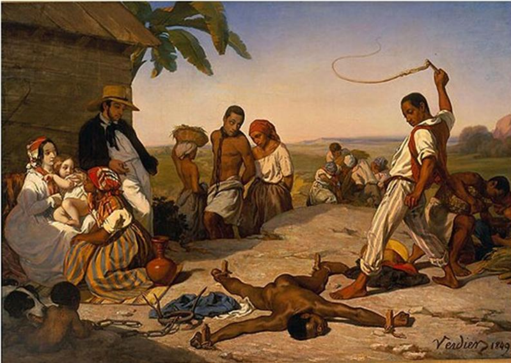
DOC 1, Marcel VERDIER, Le châtement des quatre piquets dans les colonies, 1843. 2,65 x 2m, The Menil Foundation, houston, Texas, Etats-Unis