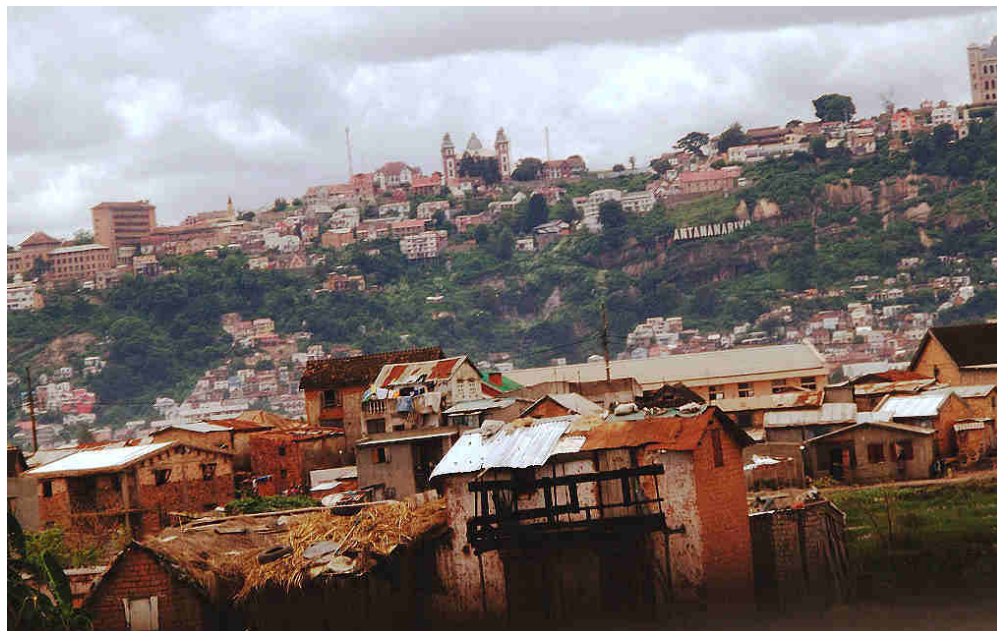
Vue d'Antananarivo, février 2012, Site de Soahary, blogueuse malgache, page consultée le 13/10/16