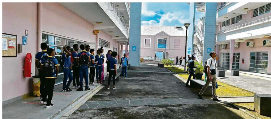
Journée portes ouvertes : des élèves de collèges du secteur viennent s'informer sur les filières proposées.

Le lycée propose également trois baccalauréats professionnels. Le bac pro AGORA forme des assistants administratifs capables d'intervenir dans la gestion, l'organisation et la relation client. Le bac pro Métiers de la logistique prépare des professionnels polyvalents, présents à toutes les étapes de la chaîne logistique. Le bac pro Organisation de transport de marchandises conduit à des fonctions d'assistant d'exploitation transport, de gestion des expéditions ou