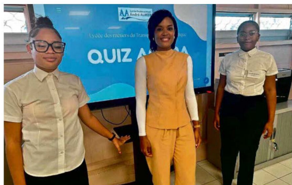
La terminale AGORA au lycée André-Aliker : une formation tournée vers la gestion et l'organisation.