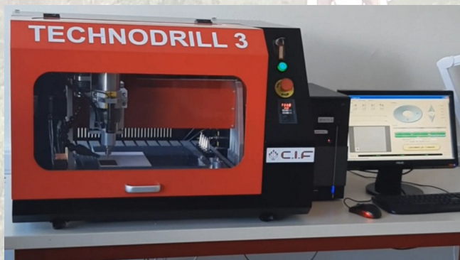
Réalisation des circuits imprimés