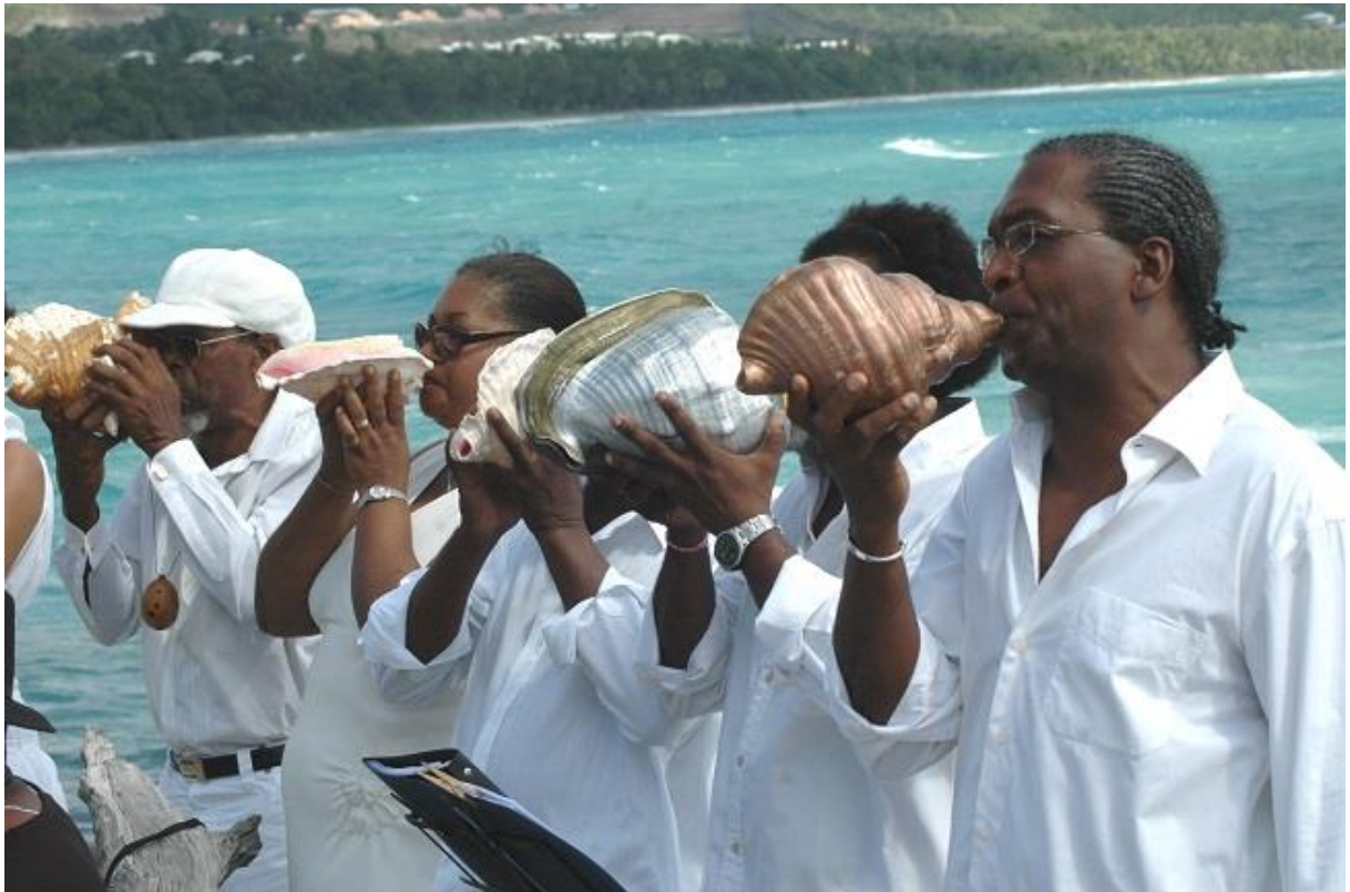
Watabwi souffle le son de départ Tanbou bo kannal anime le déboulé au son de « Tjè-nou blendé »