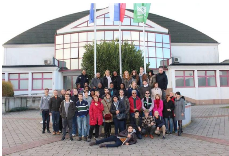
Elèves et professeurs du partenariat

Du 6 au 12 Novembre 2016, 5 élèves et 5 professeurs du Lycée Professionnel la Trinité ont rencontré leurs partenaires européens (le Portugal, l'Italie, la Slovénie et l'Estonie) dans le cadre du projet ERASMUS+ « Education au Patrimoine via les parcours de santé » pour lequel l'établissement est coordonnateur.