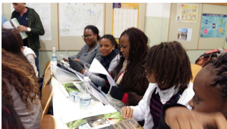
Nos stagiaires très assidues

Tous les élèves et enseignants ont participé à une formations sur les applications et outils Google comme alternative pour l'enseignement et les apprentissages mais également comme facilitateur pour le travail pratique et collaboratif du projet.