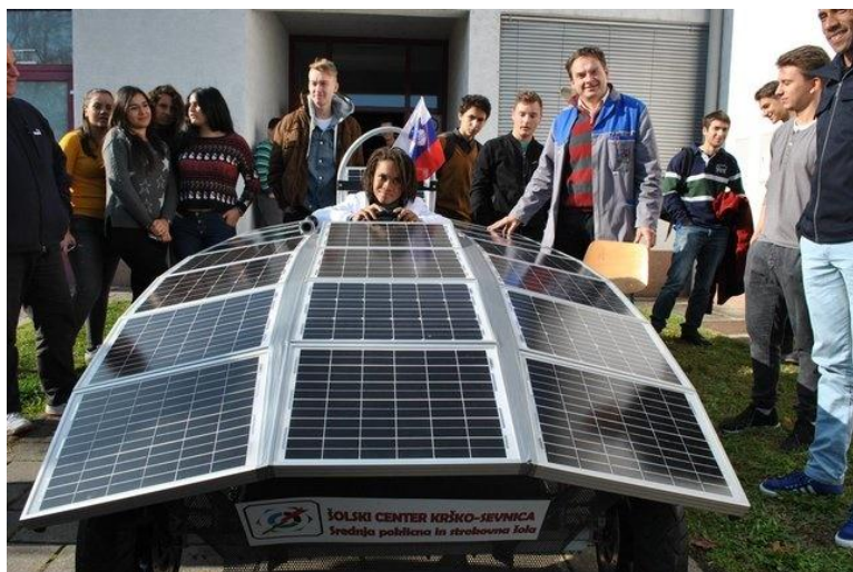
Une élève du LP LA TRINITE au volant de la voiture solaire

Cette première rencontre s'est réalisée sur deux axes :