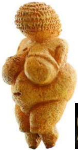
La vénus de Willendorf -29 000 ans

Des coiffures organisées des Vénus paléolithiques aux perruques extravagantes de l'Égypte antique, Des coiffures sculpturales de l'Afrique précoloniale à la radicalisation de l'esclavage Des sublimes « Maré têt » au lissage De l'afro du Black power, puis du curly jusqu' au Nappy .....découvrons l'histoire du cheveu crépu