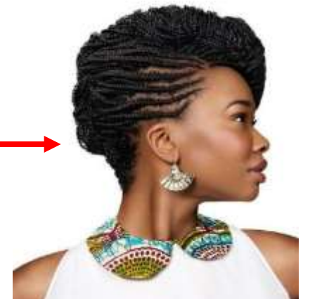
Coiffure Nappy 2019