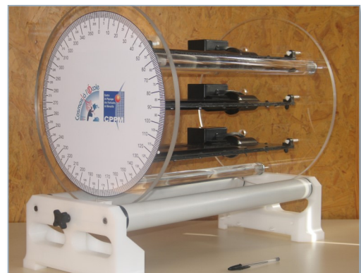
Le cosmodétecteur mis à disposition des établissements scolaires du réseau « COSMOS à l'École ».