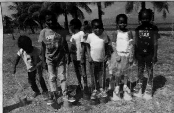
Les jeux de motricité ont remporté un vif succès.