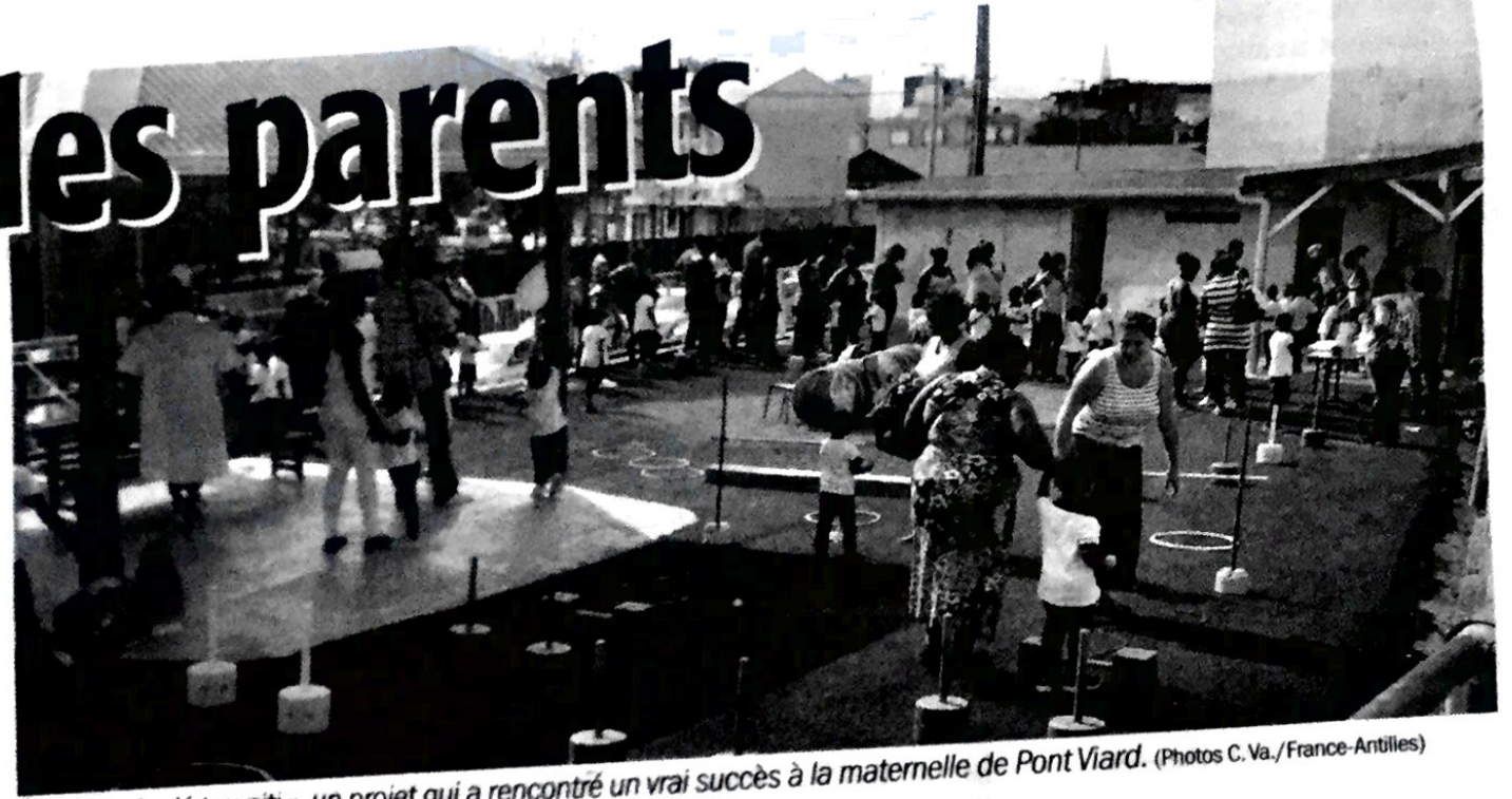
« An ti tan ba lé tou piti », un projet qui a rencontré un vrai succès à la maternelle de Pont Viard.