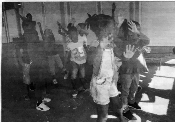
La danse et l'expression corporelle, comme le jeu, occupent une place importante dans l'apprentissage des jeunes enfants.