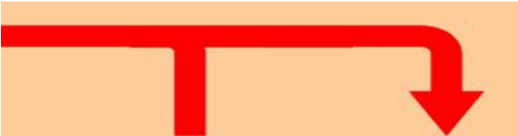
Flèche 5 partie 2