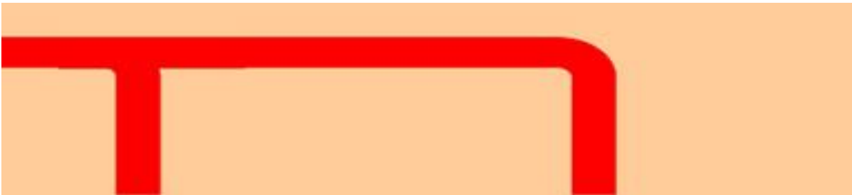
flèche 6 partie 2