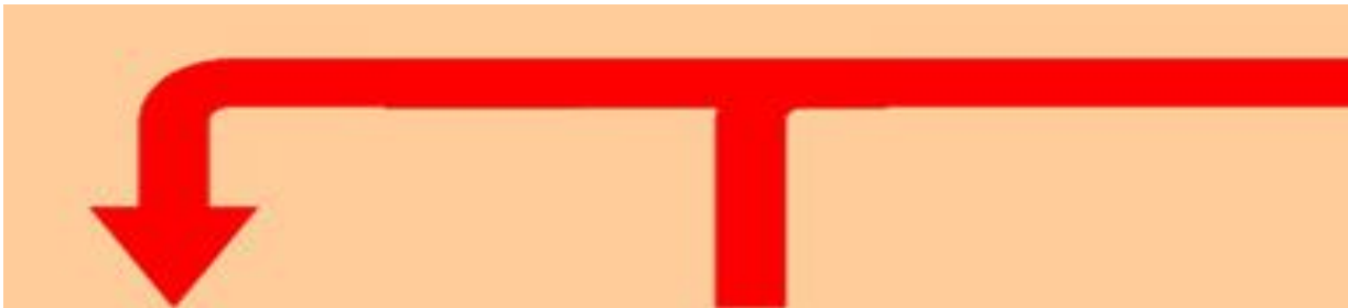
Flèche 6 partie 1