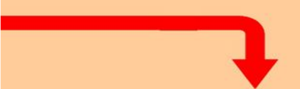
Flèche 3 partie 2