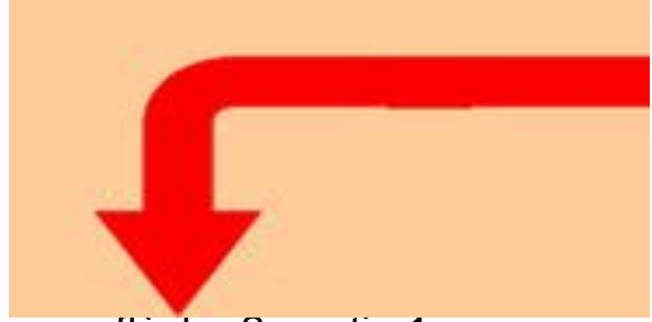
flèche 2 partie 1