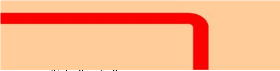
flèche 2 partie 2