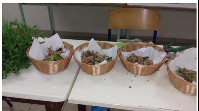
Préparation des paniers commandés