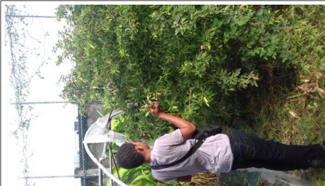
Récolte des pois d'Angole

L'atelier ERE (Horticulture) remercie les personnes qui ont contribué à l'activité « commerciale » de leurs productions.