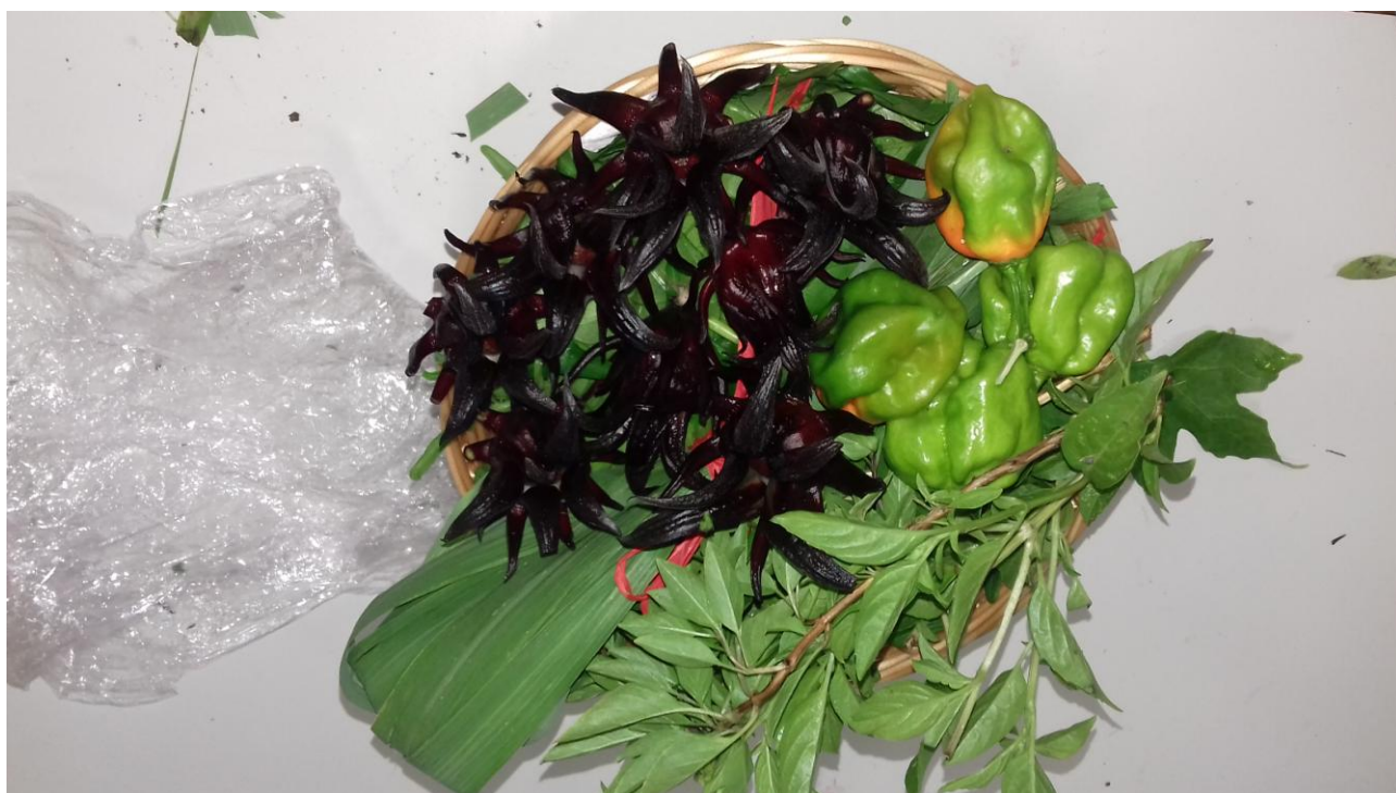
Panier maraîcher complet prêt à la commande: Groseille- pays, pois d'Angole, Epinards de Cuba, Piments forts , Citronnelle et Basilic