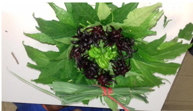
Epinards, Groseilles -pays, piments forts et placés en dessous : pois d'Angole..