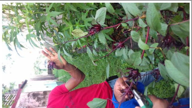
Cueillette des Groseille pays